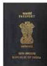
एम पासपोर्ट सेवा कार्यकर्म, पासपोर्ट और